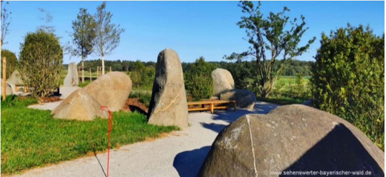
magische Steine als besonderer Kraftort in der Oberpfalz