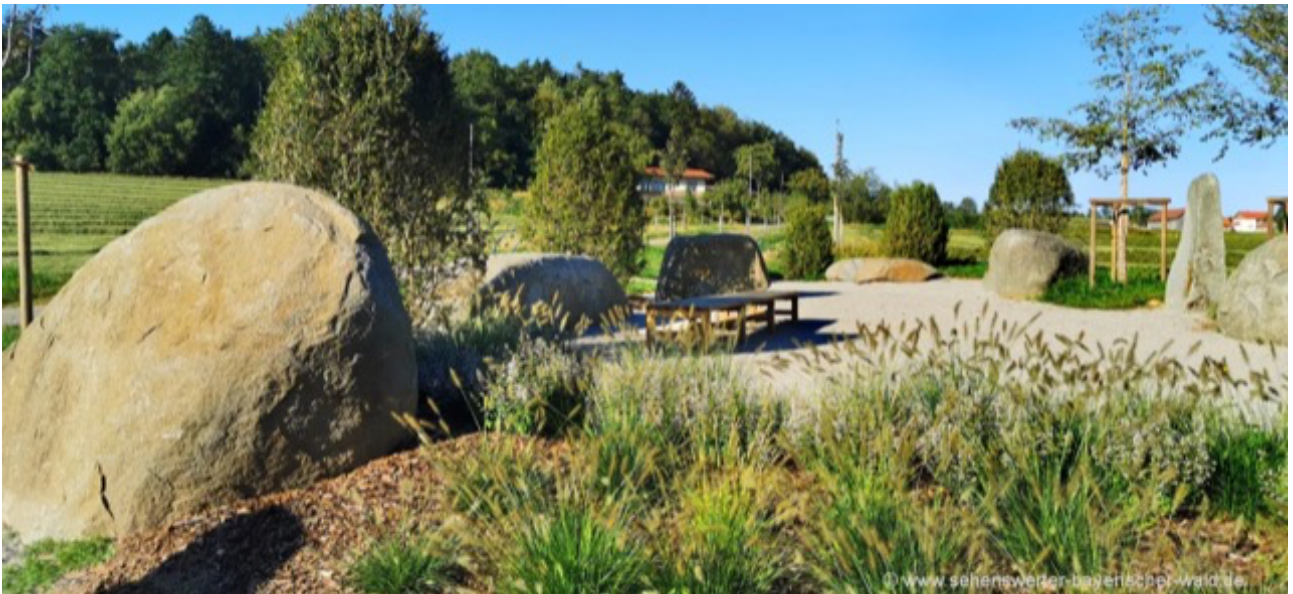
Steinfühlpark zum Himmel – Steinpark und Kraftort in Postfelden, Oberpfalz